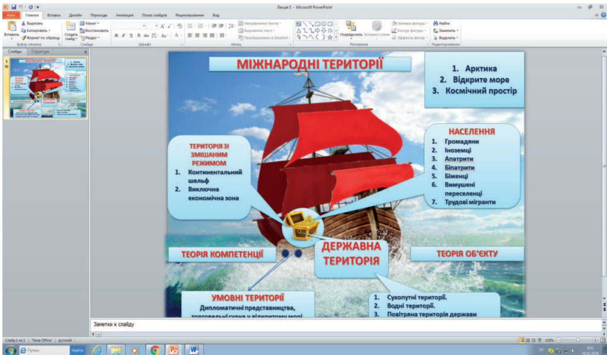
Рис. 2. Скрайбінг-презентація до лекції «Територія, населення та міжнародне право» з елементами мнемоніки

і ним можуть користуватись за призначенням усі, хто забажає. Скриня на борту корабля – це державні території. Повідомляємо в ході лекції, що таких скринь на борту є багато, кожна з них має своє внутрішнє наповнення та відіграє певну роль. Всередині скрині – населення країни. Для прикладу беремо цукерки. Скриня заповнена різними цукерками: із чорного та молочного шоколаду, карамельок тощо. Створюємо асоціативний зв'язок із видами населення: громадяни, апатриди, біпатриди, іноземці, біженці тощо. Кожна скриня має обгортку, яка відділяє скриню від корабля. Це території зі змішаним режимом, правовий режим яких визначається одночасно як нормами міжнародного права, так і нормами національного права прибережної держави [4]. Застосувавши асоціативні лінії, розглянемо кожен вид міжнародних територій, не забуваючи використовувати мнемоніку впродовж усієї лекції.