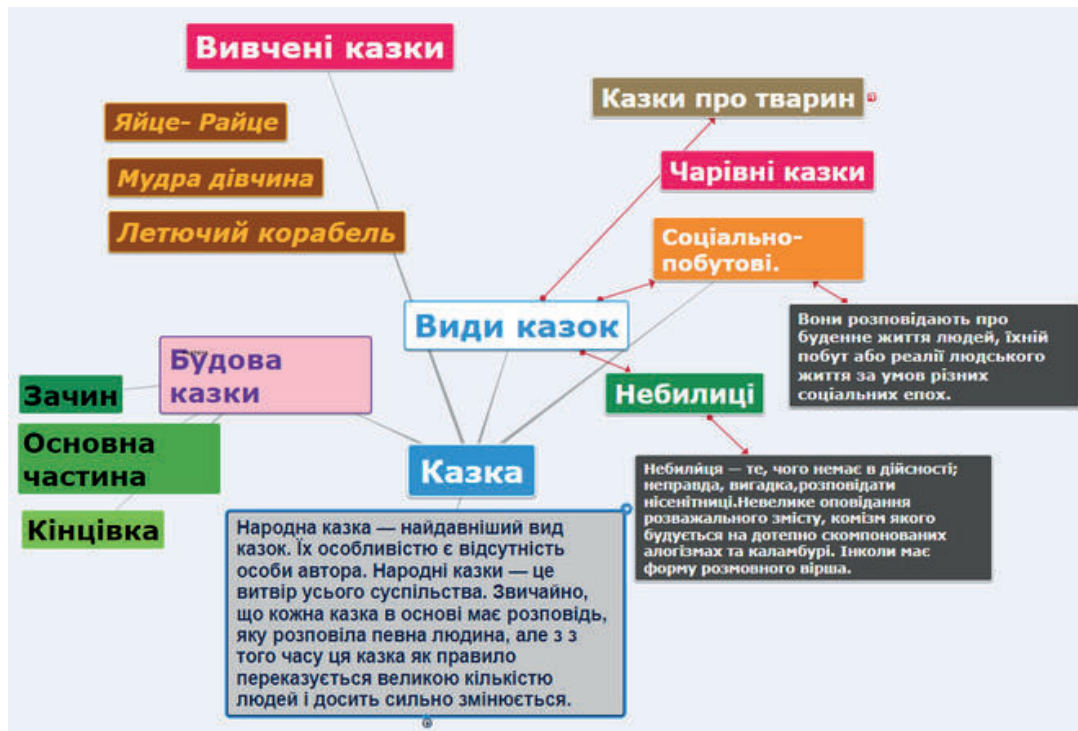
Рис. 2. Ментальна карта «Види казок» (за матеріалами [2])

Висновки. Зважаючи на викладене вище, зазначимо, що використання ментальних карт забезпечує високий ступінь залученості учнів до освітнього процесу, адже при їх використанні вони із пасивних отримувачів знань перетворюються на активних учасників освітнього процесу. Застосовуючи інтелект-карти у навчанні, діти вчать вибирати, структурувати запам'ятовувати та відтворювати ключову інформацію.