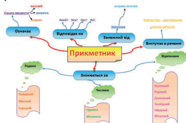
Рис. 1. Ментальні карти, розроблені під час вивчення самостійних частин мови (за матеріалами [2])

Як приклад, розгляньмо ментальні карти, що використовуються на уроці української мови в ході вивчення самостійних частин мови (у нашому випадку – іменника та прикметника) (див. рис. 1). Означені інтелект-карти мають очевидні переваги перед класичними презентаціями, оскільки дають змогу не лише оцінити матеріал цілісно, всебічно, а й при цьому не замінюють схем і таблиць, навпаки, виступають своєрідним доповненням до них.