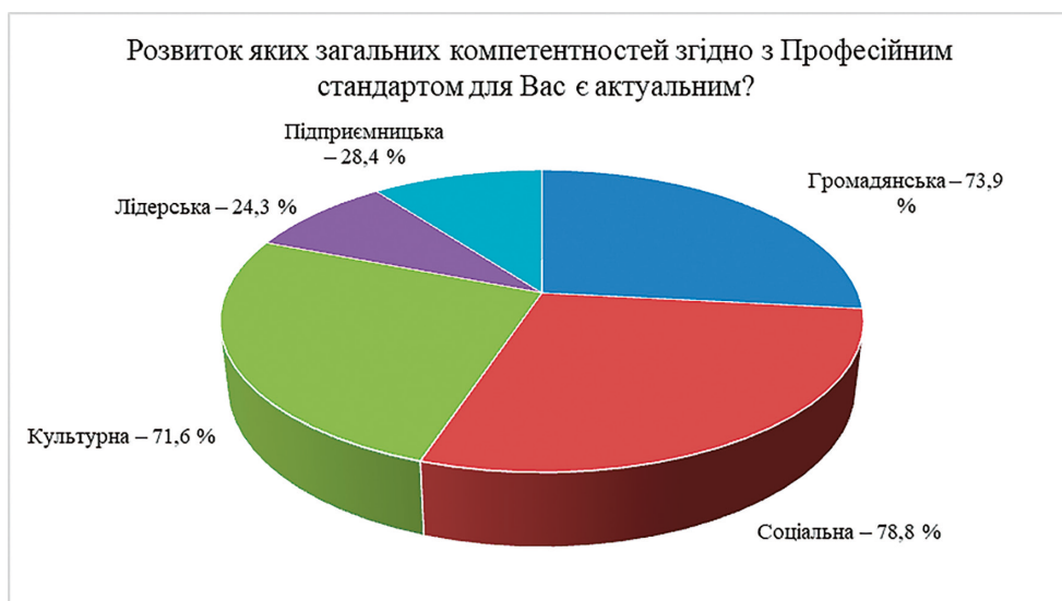
Рис. 2. Структура загальних компетентностей професійного стандарту