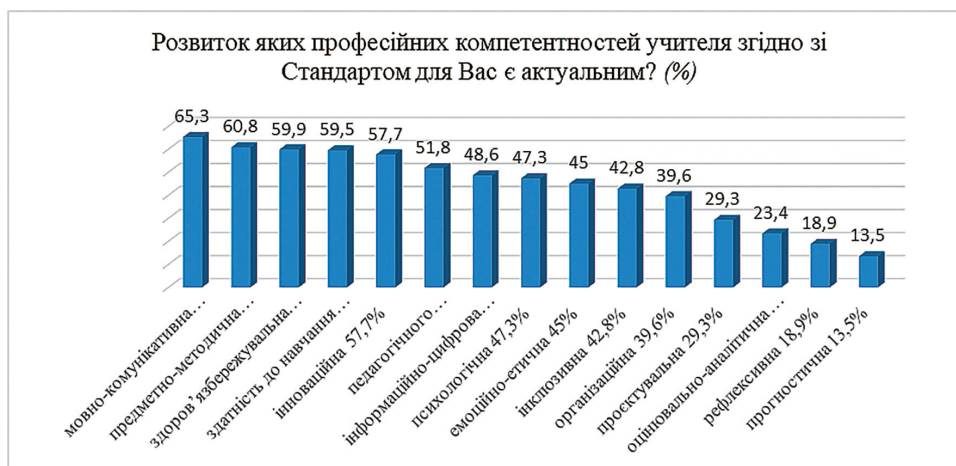
Рис. 3. Структура професійних компетентностей учителя згідно зі стандартом професійного розвитку