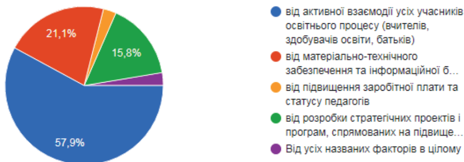
Рис. 2. Відповіді респондентів на запитання «Від чого залежить покращення стану забезпечення якості освіти?»

на друге – забезпечення освітніх закладів належною матеріально-технічною та інформаційною базою (21,1 %), а також вони вказали на необхідність розробки стратегічних проектів і програм, спрямованих на підвищення якості освіти в освітньому закладі (15,8 %) (див. рис. 2).