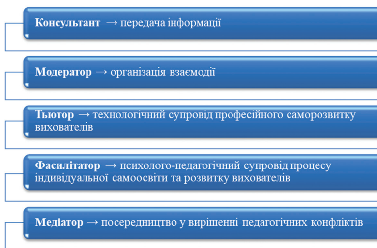
Рис. 3. Професійні функції педагога-дорадника у закладі освіти

а педагог-дорадник повинен виступати у різноманітних професійних ролях (або одній із них) (див. рис. 3):