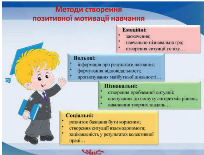
Рис. 3. Методи створення позитивної мотивації до навчання

(див. рис. 3), спрямовані на формування позитивних мотивів учіння, стимулювання пізнавальної активності, збагачення учнів навчальною інформацією, зокрема через методи формування інтересу до навчання (пізнавальні ігри, цікаві досліди, методи емоційного стимулювання, робота над проектами тощо).