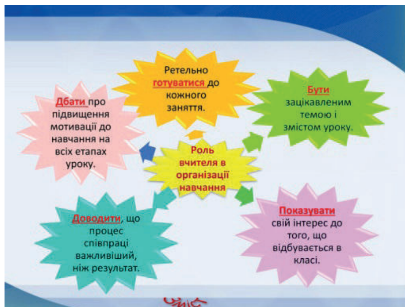
Рис. 2. Роль учителя в організації мотивованого уроку

Мотивація на уроці – це не одноразова акція, а цілеспрямована й клопітка праця, покликана організувати й тримати в полі зору учнівський інтерес до пізнання нового впродовж усього навчального часу. Особлива роль в організації такого освітнього процесу відводиться майстерності вчителя (див. рис. 2).