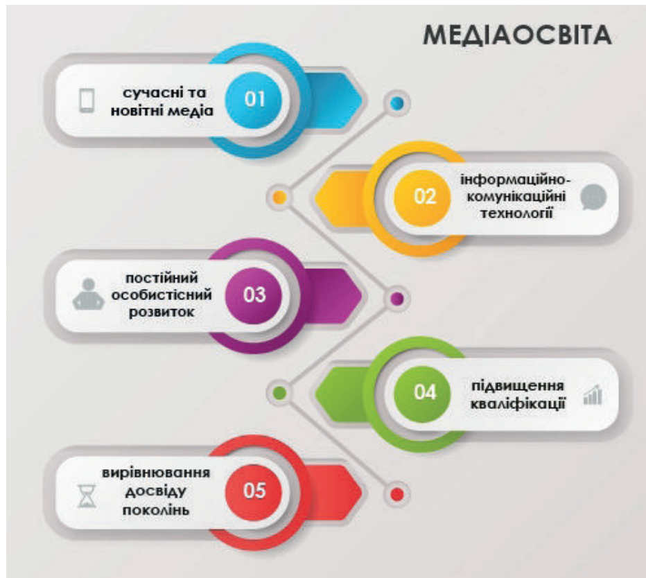
Рис. 1. Складові медіаосвіти (авторський)

Медіаосвіта – це не лише шлях до ефективності діяльності людини в системі трудових відносин, а й спосіб залишатися самим собою, тобто цілісною особистістю, здатною до самовираження і людяності. Не втрачають значення і традиційні завдання медіаосвіти, які полягають у запобіганні вразливості людини до медіаманіпуляцій і медіанасильства, «втечі» від реальності, профілактиці поширення медіазалежностей (див. рис. 1).