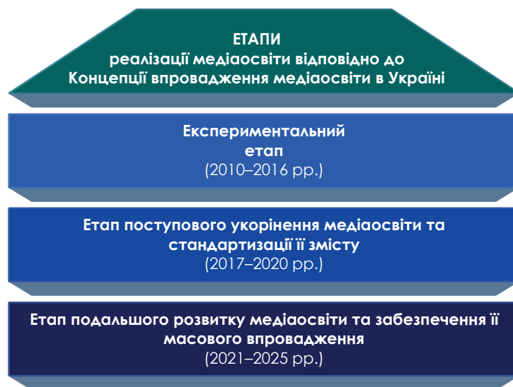
Рис. 2. Етапи реалізації медіаосвіти відповідно до Концепції впровадження медіаосвіти в Україні (авторський)

21 квітня 2016 року Президія Національної академії педагогічних наук України схвалила нову редакцію Концепції впровадження медіаосвіти в Україні. Означена концепція базується на вивченні стану медіакультури населення України та міжнародному досвіду організації медіаосвіти. Вона спрямована на підготовку і проведення широко-масштабного поетапного експериментального та подальшого інтенсивного масового впровадження медіаосвіти, зокрема й у педагогічну практику на всіх рівнях (див. рис. 2).