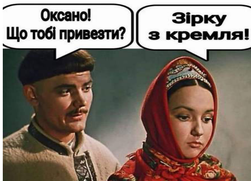
Рис. 1. Інтертекстуальність як особливість інтернет-фольклору

Однією з особливостей інтернет-фольклору є інтертекстуальність, що проявляється в компіляції як прямих цитат, так і алюзій на відомі фольклорні, літературні тексти, ще більшою мірою – на кінофільми. Приклад подібної компіляції представлено на рисунок 1 .