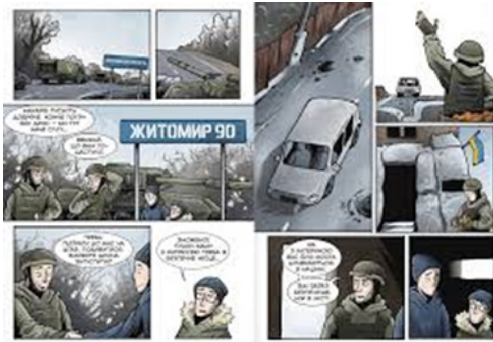
Рис. 4. Приклад вебкоміксів воєнної доби

Важливою частиною сучасного інтернет-фольклору завдяки креативності та індивідуальності своїх авторів стали вебкомікси (див. рис. 4) – послідовна низка малюнків, що супроводжуються короткими текстами, обрамленими у форму хмари, які передають думку або мовлення персонажа та загалом являють собою зв'язну історію, яка публікується в інтернеті (До-вженко та ін., 2022).