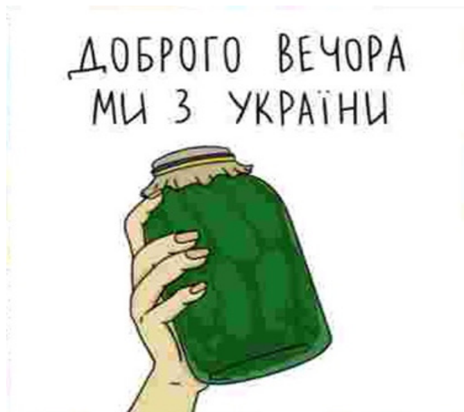
Рис. 2. Приклад інтернет-мемів російсько-української війни

Ще одним із нових жанрів інтернет-фольклору є демотиватор – постер у вигляді скомпонованого за певним форматом графічного зображення (картинки,