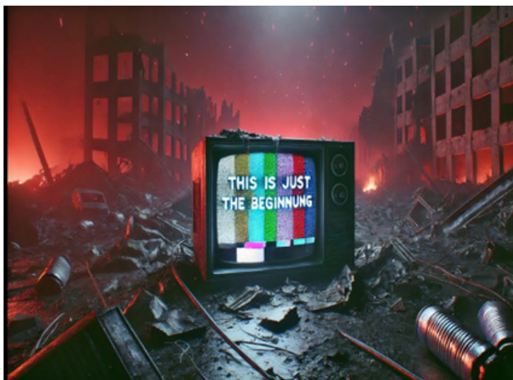
Рис. 6. «Світ, який вже зник» – українська крипіпаста на тему ядерної катастрофи

«копіпаста» та англійського прикметника «сгееру» – «моторошний» і означає готичний контент та «страшилки», що поширені в інтернеті шляхом копіювання-вставлення (Чорнобильський, Кирилова, 2021). Прикладом української крипіпаста, що виникла після неодноразових погроз володимира путіна застосувати ядерну зброю, є моторошна історія про ядерний апокаліпсис під назвою «Світ, який вже зник» (див. рис. 6).