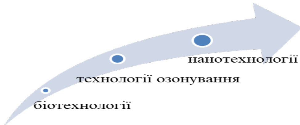
Рис. 2. «Вектор думок»

Завдання 4. Побудуйте «вектор думок» щодо вирішення проблеми очищення атмосферного повітря. Наведіть приклади. Запропонуйте свої ідеї.